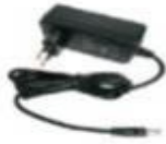
DC12V/3A Power Supply